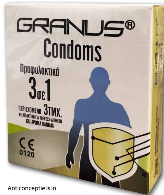
Anticonceptie is in Griekenland een typische mannenzaak