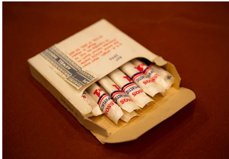
Condooms, 'vermomd' als sigaretten