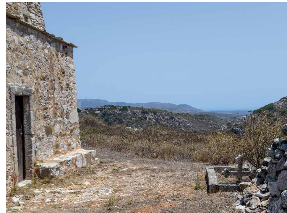
De Ayos Dimitris

De Nikon is opgetrokken uit onbewerkte natuurstenen. De wijde koepel is meer ovaal dan rond. Aan de oostkant van de kerk springen twee halfronde apsiden naar voren.