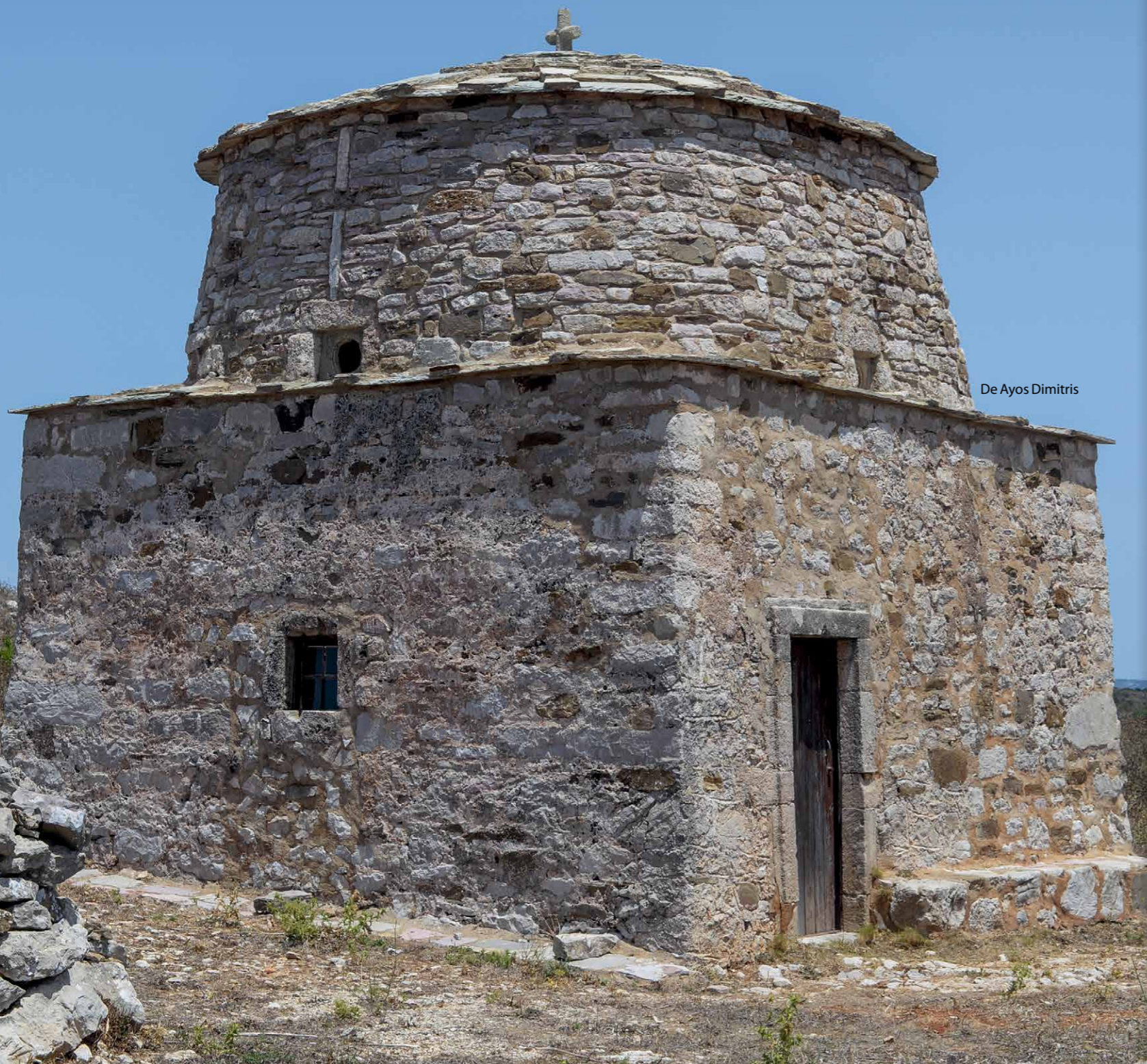
De Ayos Dimitris

Tijdens een wandeltocht op Kýthira stuit je altijd wel op een Byzantijns kerkje. Er zijn er zo'n 300 geteld, verspreid over het eiland. Je vindt ze overal: aan de kust, op de top van een heuvel, aan de rand van een dorp en vaak zelfs in een afgelegen veld. In het laatstgenoemde geval vraag je je af: waarom zover van de bewoonde wereld?