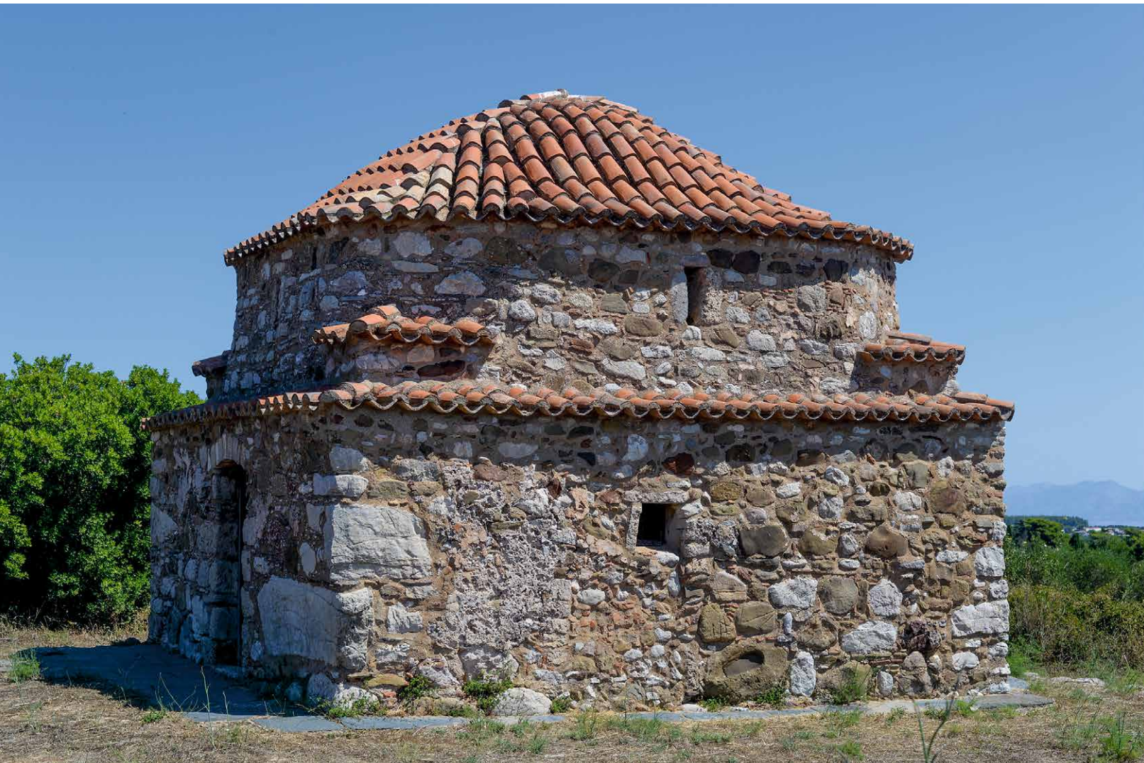
De Ayos Nikon

met de portretten van de adellijke eigenaars in de apsis.