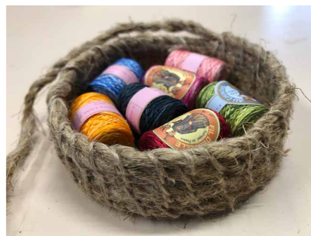
Het biblebontse bakje