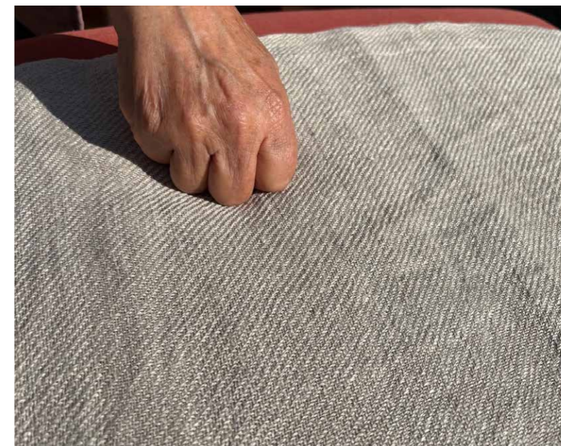
Matrasdek Nitsa revisited

Maar dit was toch eigenlijk niet mijn streven. Ik ben een weefster. Dus ging ik eerst weer verder spinnen, met het meegebrachte materiaal. De draden die ik op deze manier