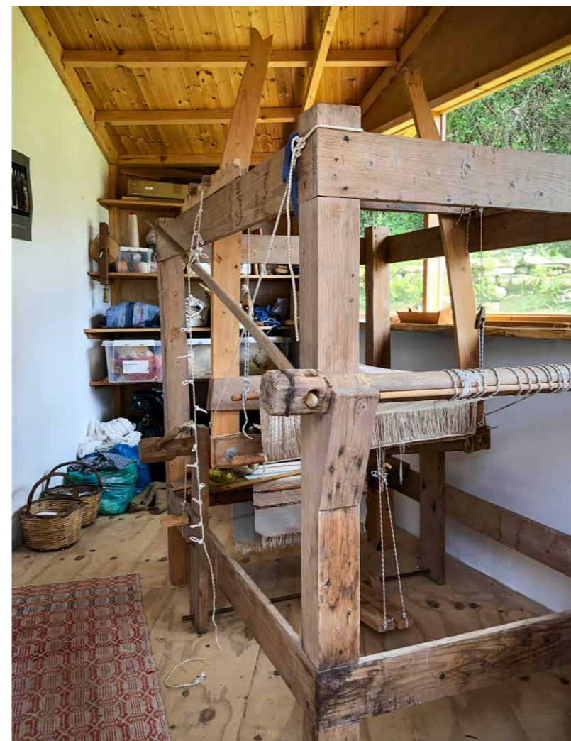
Het oude Griekse weefgetouw