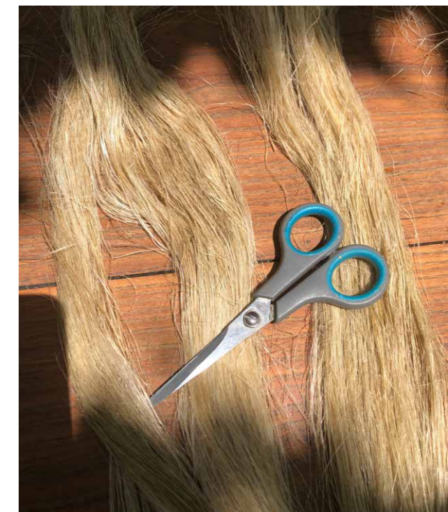
De eerste glanzende resultaten

vaak gezien, al die werkzaamheden, en ze herinnerde zich de namen ervan weer. 'To pótisma, to sápisma, ...o mánganos' (nat maken, roten, braak, red.) Ze herinnerde zich hoe mooi ze het vond, dat glanzende linnen, dat tevoorschijn kwam uit die stengel, na al dat gebeuk... 'Maar zo'n mooie 'mánganos' – onze Achterhoekse braak – hadden we niet. Wij hadden gewoon een zwaar stuk hout en beukten ermee op een steen.' Dat vond ze maar primitief. 'Maar jullie maakten wel het mooiste linnen', wierpen wij tegen. 'Des te knapper.' Wij vinden het natuurlijk juist interessant op deze manier weer achter oude methoden te komen, die je niet zo gemakkelijk ontdekt. Het zijn de herinneringen die boven komen bij de lokale mensen doordat zij 'de oude geluiden' horen, en de oude methoden weer zien. Het zijn herinneringen die tevoorschijn komen wanneer je dingen doet, niet wanneer je er alleen maar over praat.