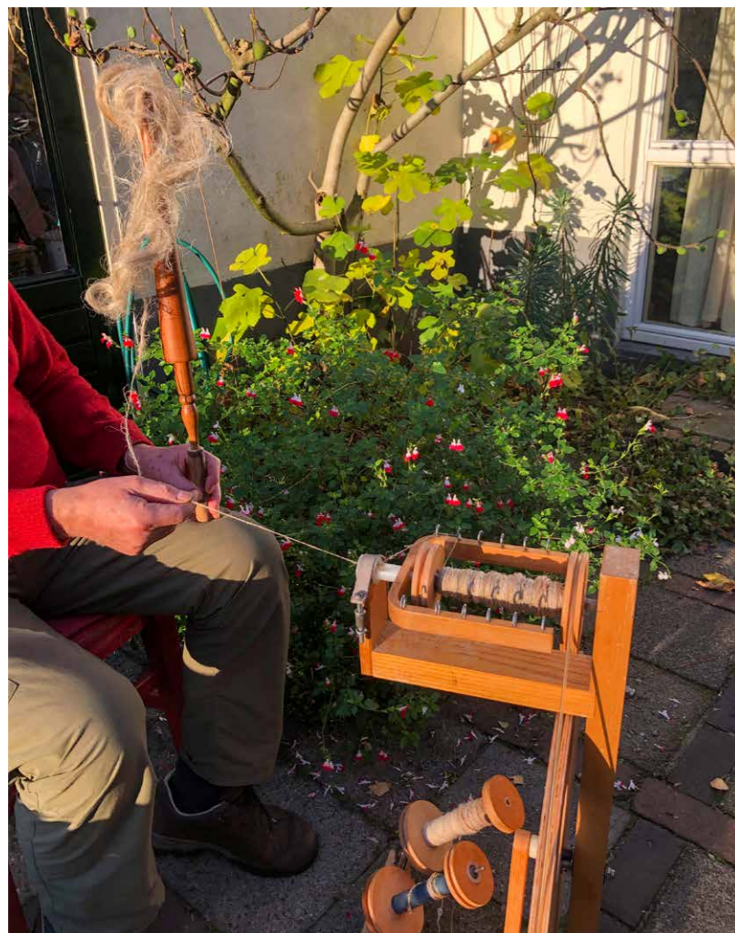
Vlas spinnen van een rommelig rokken

Maar nu moesten we weer naar huis. En het was nog lang niet klaar! We mochten het vlas gelukkig opslaan in de droge kelder van de burens. Maar dan moest het wel droog erin. Zo