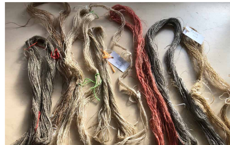
Gesponnen draden, deels geverfd

gebeurde het vroeger in Nederland ook: in de zomer werd het vlas geoogst, geheld, geroot en gedroogd, en dan werd het opgeslagen tot men er in de winter, wanneer er meer tijd was, mee verder kon. Het braken gebeurde dan in een zogeheten 'braakhok' – in Friesland kun je ze nog vinden – waar men al gauw stoflonen kreeg van al het rondvliegende stof. Gelukkig kunnen wij het allemaal buiten doen! Dus legden we al het resterende vlas te drogen op de weg in de zon. Ook nog spannend of je het dan op tijd gedroogd krijgt. Aan het eind van ons verblijf is het altijd een drukte van belang. Nu wilde ik ook van al het materiaal een sample meenemen, om die in Nederland te kunnen bespreken en vergelijken met mijn vlasvriendinnen. We hadden twee koffers vol vlas, in alle stadia van verwerking. Een deel zou ik dan in Nederland verder verspinnen en weven.