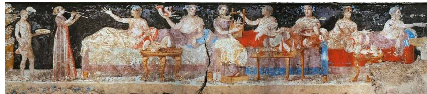
3 | Middendeel van de schildering, het feestmaal

zilveren eet- en drinkgerei, zware vaten en schalen van metaal, sieraden en dure wapenrustingen.