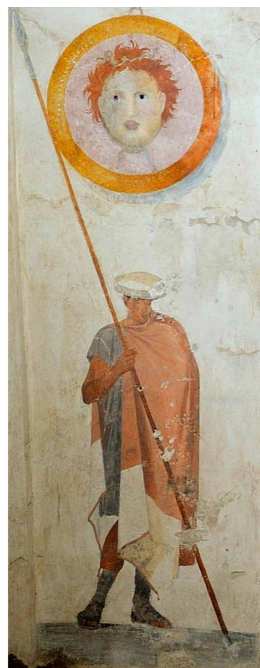
7 | Hopliet links van het graf met het schild van Medusa

Boven de twee hoplieten hangen hun schilden aan de muur en zelfs de spijkers waaraan ze hangen zijn in perspectief, namelijk diagonaal weergegeven. Op het linker schild staat