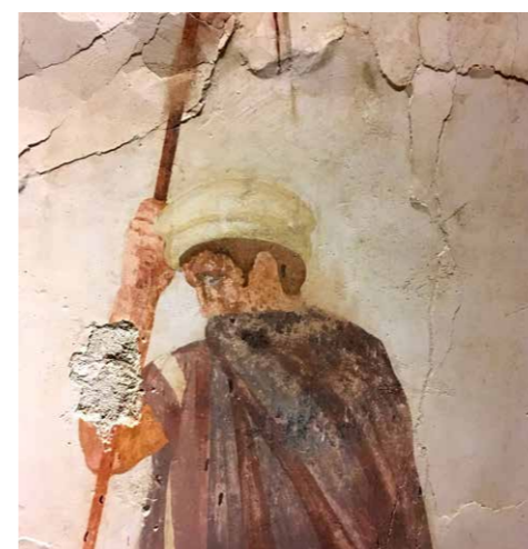
8 | Hopliet rechts van het graf met droeve gelaatsuitdrukking