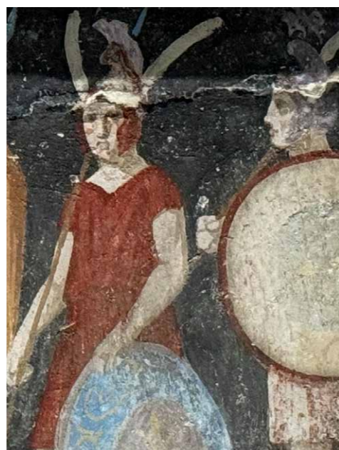
5 | De personen met witte veren op hun hoofdtooi

Twee Macedonische hoplieten aan beide zijden van de deuropening vormen het sluitstuk van de schildering. Hier zien we niets van de vreugde en opgewekte stemming van het feestgelag. De twee mannelijke figuren lijken overstelpt door ingehouden verdriet. Ze zijn iets kleiner dan gebruikelijk, ongeveer 1 meter 50. De man aan de linkerkant (afb. 7) wordt en face afgebeeld, de ander