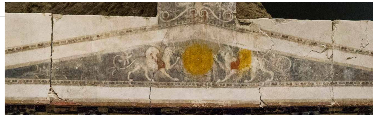
2 | Fronton met griffioenen en zonnediscus

De grafkamer in Ayos Athanásios bleek al leeggeroofd te zijn. Dat is niet vreemd omdat al sinds de Oudheid op de inhoud van grafmonumenten werd geaasd. Grafschenkers wisten immers dat de familieleden waardevolle kostbaarheden bij hun dierbare overledene legden, zoals gouden kransen,