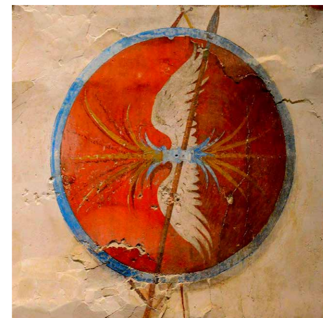
9 | Schild met de bliksem van Zeus

Onze onbekende krijger stierf ergens tussen 320-300 v.Chr. Waarschijnlijk heeft hij tijdens de veldtochten van Alexander de Grote