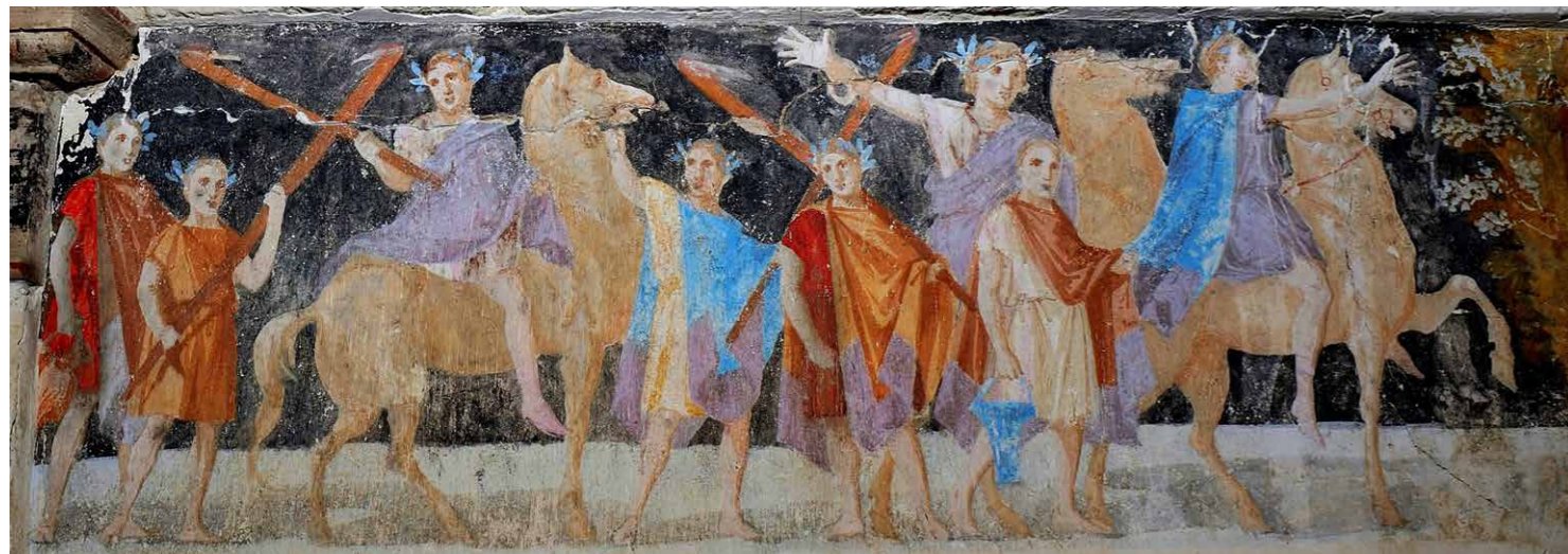
4 | Linkerdeel van de schildering, de aankomst van de gasten

fakkels die sommigen van hen vasthouden. Ook zij hebben allen een krans op het hoofd. Ze komen misschien van een ander feest om hun vrienden te ontmoeten die op deze lentevond van hun wijn genieten in de buitenlucht zoals we kunnen afleiden aan de boom waartegen de kilikio is geplaatst.