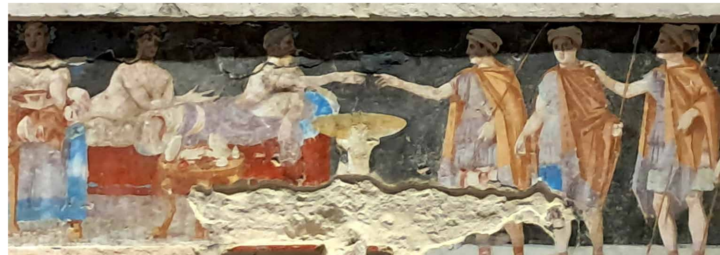
6 | De uitgestrekte vingers, gebaar van vriendschap en eerbied

een afbeelding van het hoofd van de Gorgo (afb. 7) dat wil zeggen Medusa. In het Hellenistische tijdperk heeft de Gorgo haar afschrikwekkende kracht grotendeels verloren en is ze niet meer de duivelse kracht die eenieder die haar aankeek in steen veranderde. Toch doen haar knalrode haar en de grijsblauwe slangen die haar jeugdige gezicht omringen nog denken aan haar demonische natuur, hoewel haar melancholieke blik naar