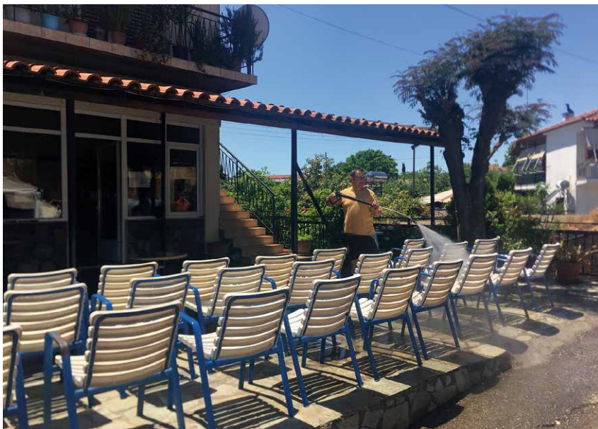
Grote schoonmaak voor de heropening