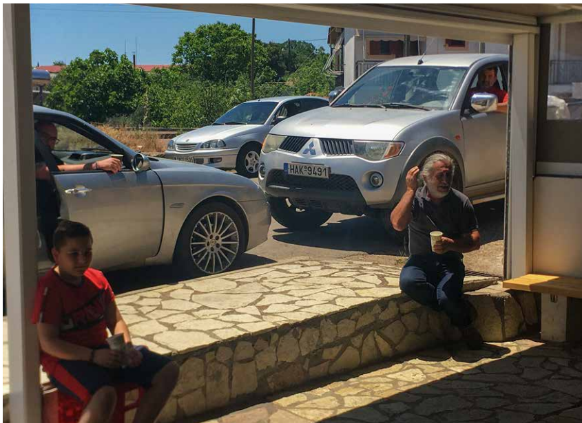
Toch even naar het kafenio , voor een gesprek vanuit de auto