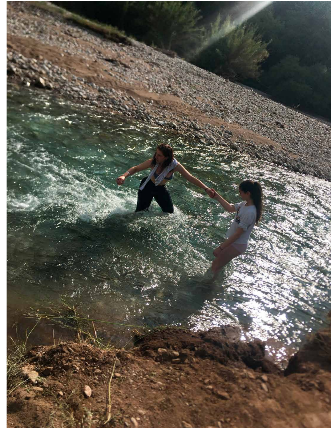
Gedwongen onthaasting in de natuur

Al bij aankomst op het vliegveld in Athene werd meteen duidelijk dat dat gevoel van urgentie in Griekenland wel alom aanwezig was. In de aankomsthal werden we door een aantal dames, uitgerust met mondkapjes en handschoenen, ontvangen met flyers over het virus en de geldende regels. Op onze telefoons rinkelde het ene na het andere sms'je binnen met soortgelijke informatie. Overal stond desinfecterende gel en mondkapjes waren gewoon verkrijgbaar. Verbaasd keken we naar het stapeltje dat mijn man Christos bij zich had toen hij ons kwam ophalen.