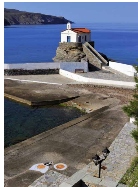
De Panayía Thalassini in Andros