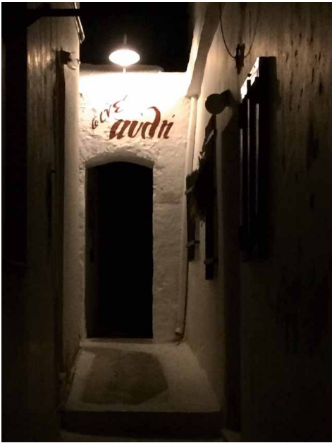
Cine Avlí, een van de openluchtbioscopen