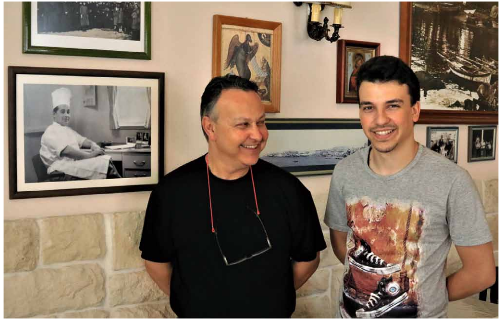
Drie generaties bij 'Stamatis since 1965'

was bijna volledig verwoest maar de machtige redersfamilies zoals Goulandrís en Embirikos wisten snel de schade te herstellen. Vooral de koop (met staatsleningen) van de Amerikaanse liberty's (vrachtschepen, red. ), de afdankertjes van de Tweede WO, bleek een succesvolle zet.