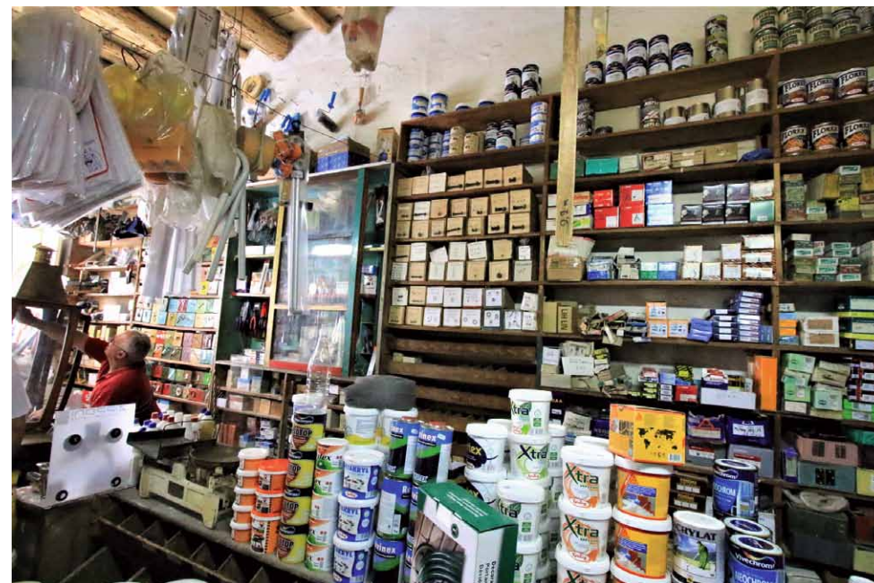
Ook na overname bleven de originele uitstraling, inrichting en sfeer van de zaak behouden

PAVLOS EMMANOULIDIS | FOTO'S AUTEUR | KAARTWERK: UVA-KAARTENMAKERS